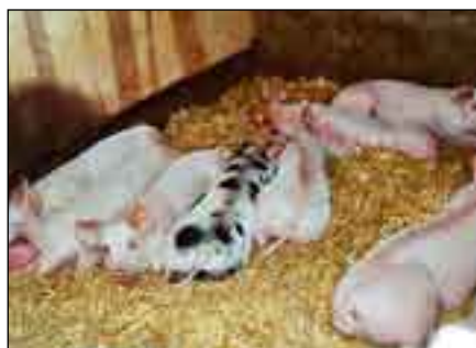
Abb.1 Stroh als Einstreu

Die Überlegungen werden an Modellbetrieben vorgestellt, und die Berechnungen erfolgen mit Faustzahlen. Die Situation einzelner Betriebe kann sich ganz anders darstellen. Deshalb sind die Kalkulation und die Maßnahmen im einzelnen Betrieb, der Bio-Stroh als Rohstoff verkaufen will, zu konkretisieren. Mit den gemachten Aussagen wird aber eine Richtung aufgezeigt, die unter gewissen Voraussetzungen den Verkauf von Bio-Stroh ermöglicht.