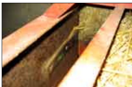
Abb.5 techn. Veränderungen/Flacheisen

- Für eine optimale Ballenqualität ist eine sehr genaue Messereinstellung zu gewährleisten. Kolbenmesser und Gegenschneide sollten möglichst nahe beieinander liegen, nicht über 5 mm (Je nach Pressentyp, siehe Bedienungsanleitung), da so ein gerader Schnitt zustande kommt, der an der fertig gesetzten Wand im Strohhaus weniger Nacharbeit erfordert. Eine Einstellung größer als 5 mm ist dann notwendig, wenn man davon ausgehen muß, dass eventuell im Pressgut enthaltene Steine die Messer zerstören können. Vor allem sollte beachtet werden, dass scharfe Messer eine Voraussetzung für einen reibungslosen Ablauf sind.